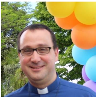
Il nuovo Parroco

fraternita S. Michele Arcangelo, il Comitato S. Michele, i Facchini e la Banda Musicale di Montopoli di Sabina. Ringrazio l'Amministrazione Comunale per la collaborazione in questi nove anni.